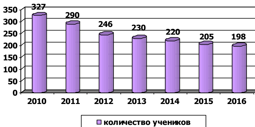
Динамика сокращения количества учеников по второму варианту:

Прямая зависимость от общего сокращения численности населения прослеживается и в количестве учащихся школ. По оценке в 2013 году количество учащихся в общеобразовательных школах составит 230 человек, что на 6,5 % ниже, чем в 2012 году (246 учащихся). В прогнозируемом периоде тенденция снижения численности учащихся будет продолжаться и к 2016 году по второму варианту прогноза составит 198 человек или на 13,9 % к 2013 году.